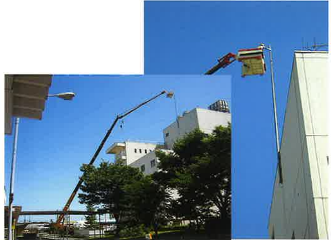
避雷針交換作業 半径30m 50Tラフター