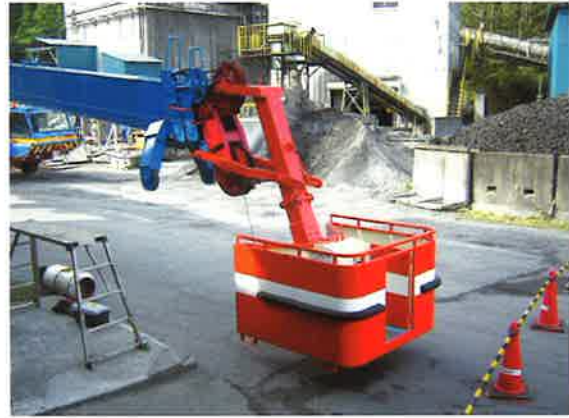
200T フルオートジブ取付

ボックスの外側は鋼板で囲い、高所における搭乗者の風よけと恐怖心を少なくしています