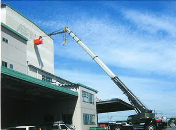
倉庫看板作業 半径30m 50Tラフター