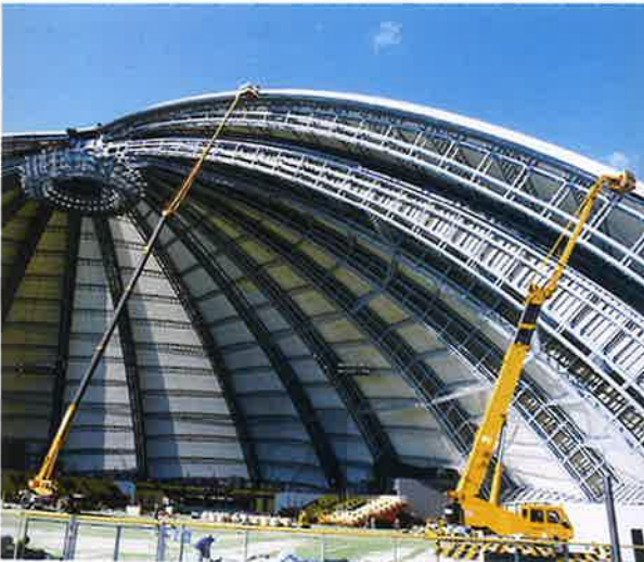
ドーム塗装 55m作業 50Tラフター