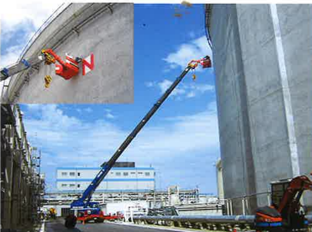
LNGタンク看板作業 半径25m 50Tラフター