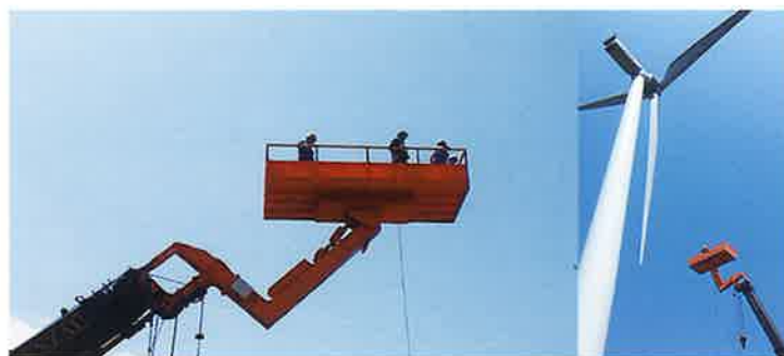
風力発電機 メンテナンス SS-450 60Tラフター取付