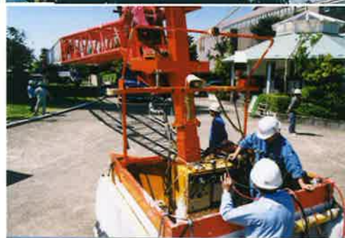
100m観音像リニューアル 100m作業 360Tクレーン