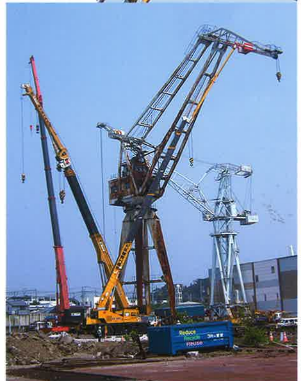
造船所クレーン解体 50m作業 50Tラフター