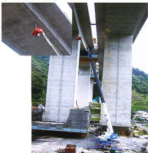
高速道 橋桁点検 40m作業 50Tラフター