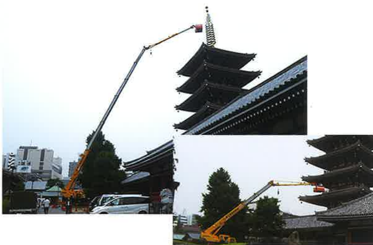
五重塔メンテナンス 50m作業 60Tラフター